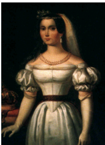
Maria Teresa D'Austria